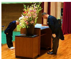
【新入生誓いの言葉代表生徒】