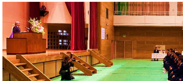
【しっかりとした姿勢で話を聴く生徒】