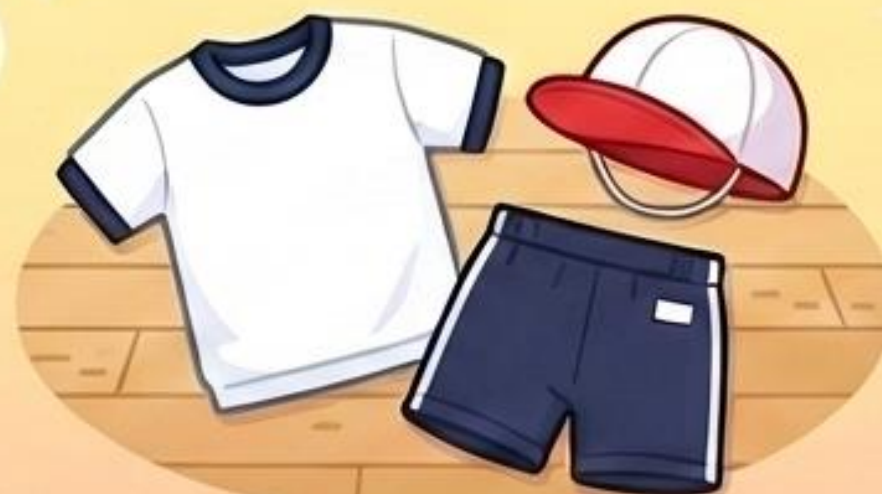
たいいくの じかん

たいいくの じかんは「たいそうふく」に きがえて、「あかしろぼうし」を かぶる！