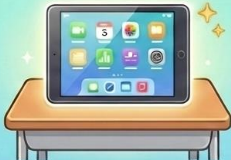
じゅぎょうの じかん