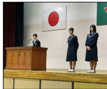
【学年代表が抱負を発表の様子】

「よく学び」というのは、一人一人が夢に向かって主体的に学習していこうということです。夢をもつことは大切ですが、それを実現するには、絶対に乗り越えなければならない壁があります。(中略)そのためには2つ、学習でがんばってほしいことを言います。1つは授業中の態度です。先生の言うことを聞くこと、わからないことは友達に「わからない、教えて」と聞くこと、4人班で一生懸命考えること。2つは家庭学習をがんばることです。(中略)たくましく、というのは少々のことへこたれない、強い精神力をもつこと、そして勝負ところで力を発揮する勝負根性をもつことを指します。中学生は思春期を迎え、いやなことたくさんあると思いますが、それに負けないうまくまさは絶対に必要です。そのためには日頃の鍛錬が大切です。甘い考えでは悔しい結果になることを覚えておきましょう。