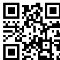
【登録のためのQRコード】

本校では、不審者情報をはじめ、学校行事の内容や時刻、持参物等、様々な情報を安全安心メールでお知らせしておりますのでご登録の程よろしくお願いいたします。また、すでに登録済みの保護者の方も、新学級が決まりましたので、〇年〇組等の「登録内容の更新」をお願いします。