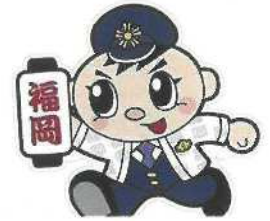
「福岡県警シンボル・マスコット」