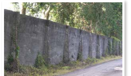
菊池恵楓園(熊本県)の隔離の壁

A 2001年(平成13年)、ハンセン病国家賠償訴訟の判決が熊本地裁であり、原告(ハンセン病療養所入所者)の訴えが認められました。国はハンセン病療養所入所者・退所者のみなさんに謝罪をし、2002年(平成14年)には、療養所を退所する人の社会復帰への援助として「退所者給与金事業」を開始しました。2008年(平成20年)には「ハンセン病問題の解決の促進に関する法律」が制定され、療養所の土地、建物等を地域に開放できるようになり、2012年(平成24年)には、菊池恵楓園と多磨全生園に保育所が開設されました。また、啓発(広く知ってもらう)活動を積極的に行うなど、名誉回復のための対策を進めています。