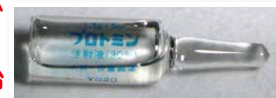
プロミン(注射薬)

A ハンセン病患者・元患者や家族への差別が生まれたのには、次のような理由がありました。 ● 全国で、ハンセン病患者を見つけ出し療養所へ入所させたりする「無らい県運動」が行われました。また、「らい予防法」という法律で患者が強制的に療養所の中に閉じ込められたり、家が消毒されたりして、感染力が強い病気、怖い病気といったあやまった考えが広まりました。 ● 有効な治療薬「プロミン」ができるまでは、治らない病気とされていました。