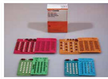
現在のハンセン病の薬

A よく効く薬があって完全に治ります。また、薬を飲むと数日で「らい菌」は感染力を失い、早期に治療すれば後遺症も残りません。今、療養所で生活している人のほとんどはもう治っています。