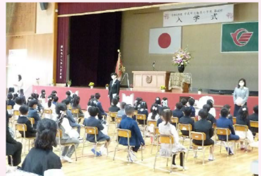
担任の先生が出席を取りました