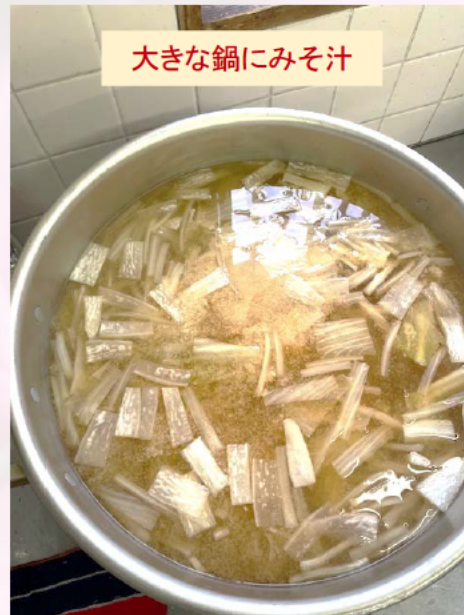
大きな鍋にみそ汁