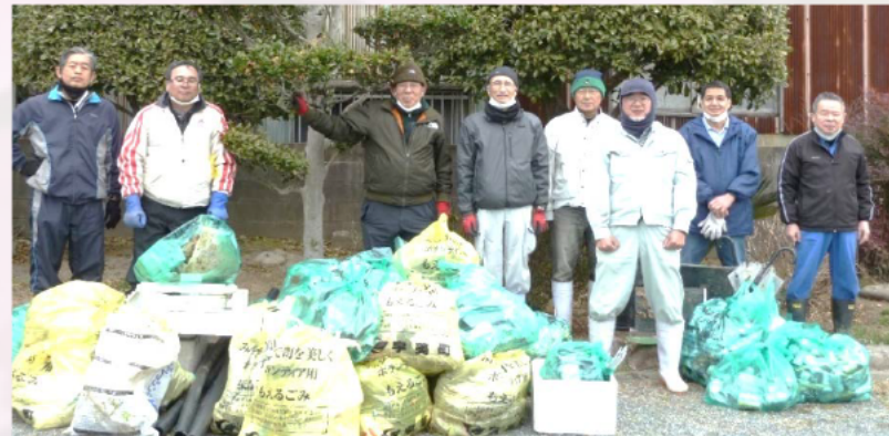
今回は、軽トラック1台半のゴミを拾いました

年に1~2回、早見の有志で、町立図書館前付近から山洪橋付近まで、宇美川の掃除をしています。空き缶やペットボトル、ビニールごみが多いですが、時には自転車やバイク、テレビのモニターなども捨てられていることがあります。