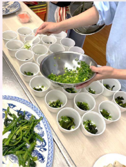
手際よくみそ汁の具(ワカメとネギ)をカップへ入れています