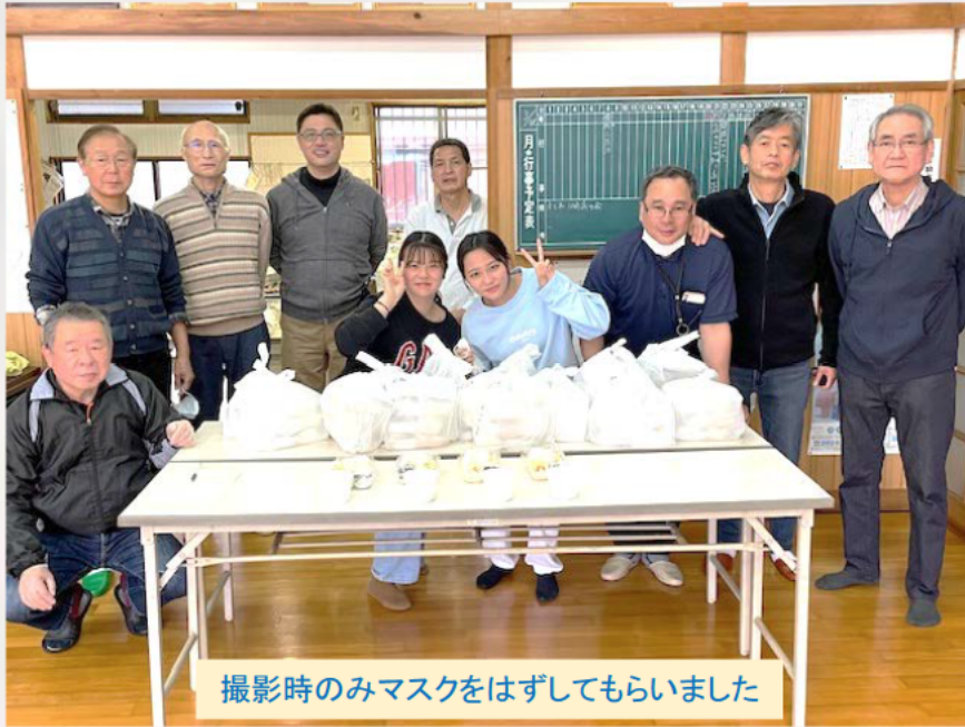
撮影時のみマスクをはずしてもらいました