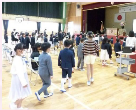
先輩に導かれて新入生入場