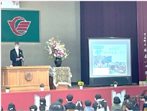
校長先生のお話し