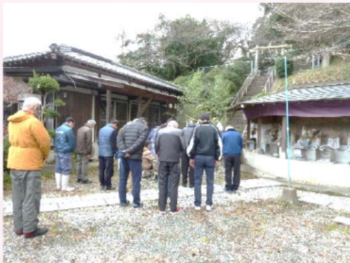
厄神様に向かって拝礼