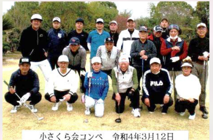
小さくら会コンペ 令和4年3月12日