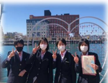
門司港レトロ散策研修