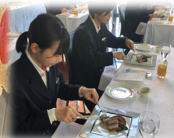
テーブルマナー講習