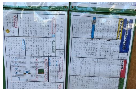
1年生 職業調べの壁新聞

1学年では、将来の夢をさがす「夢実現」プログラムの取組で、職業についての調べ学習や職業人からの話を聞いて、職業観や勤労観をもち、職業についての見聞を広める学習を行っています。1月20日（木）の「職業人に聞く会」では、3名の講師の方々から「働くうえで大切なこと」「中学生で身に付けておくべき力」などについて、素敵なお話をさせていただきました。短期・中期・長期の目標を明確に設定することや「はい」という返事やあいさつが、周りから必要とされる人々との関わりを築き自分の成長につながることを、コミュニケーションを大切に、相手の気持ちに寄り添って懸命に尽くす仕事へのひたむきな姿勢など、将来を考えるうえで大切な学びの時間となっていました。