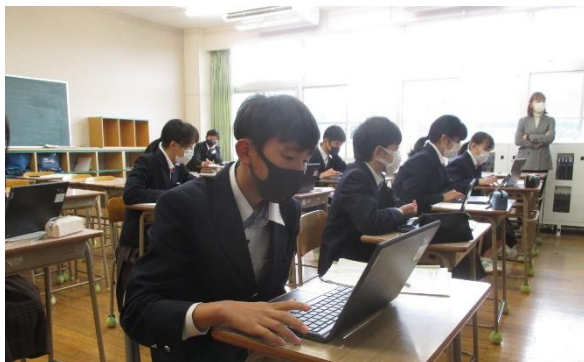
スローガンについて chromebook で下調べ