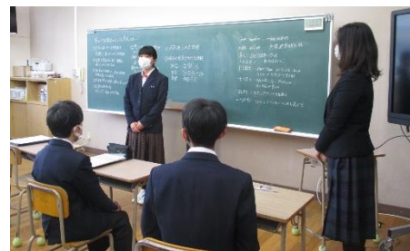
校長先生の前で決意表明

「『共律協援』というスローガンに込められた思いが修学旅行のしおりの係活動のページの隅々にまできちんと浸透し、原案がつくられていたことに感心しました。修学旅行で身に付けた「共律協援」の力を学年だけでなく全校に広げていくことが、南中をよりよくしていくことにも繋がるので、自信をもってがんばってください。そして、これから活動していく中で、何か困ったことがあったら先生たちに相談してください。先生たちは全員でみなさんに寄り添い、サポートしていきます。」と。