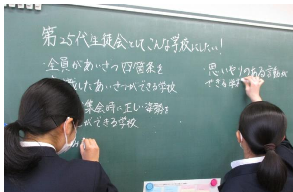
黒板にまとめ、みんなで共有し話し合いました。

話し合いを続けていました。第25代生徒会役員の本気を感じた瞬間でした。その甲斐あって素晴らしいスローガンを生み出すことができました。詳しくは昨日の生徒集会での内容です。生徒会通信も発行されると思いますので、そちらでも確認してください。