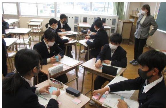
南中生の現状分析についてグルーptーク