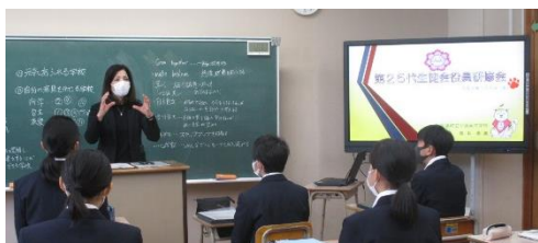
校長先生からのお話