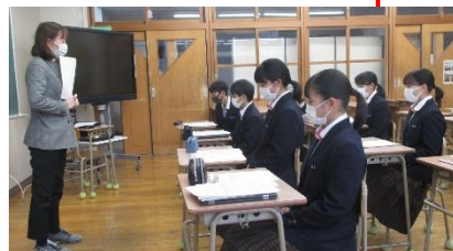
「リーダーとは」についての講義