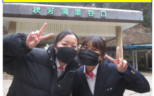
秋芳洞の入口にて「はい, チーズ!」