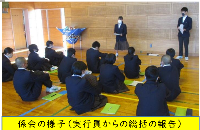
係会の様子(実行員からの総括の報告)

この事前の取り組みを通して、2年生の成長を感じています。リーダー学年として頼もしさが育ってきています。リーダーを支え、自律できる学年目指してみんなでがんばりましょう!!