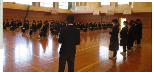
実行委員会を中心に行われた学年集会