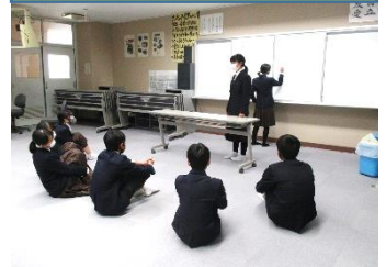
放課後の実行委員会の様子

しく思います。まだまだ、おしゃべりがあったり、話をきちんと聞いていない人がいたり課題はありますが、着実に2年生としてリーダー学年になっていく準備が進んでいると感じます。