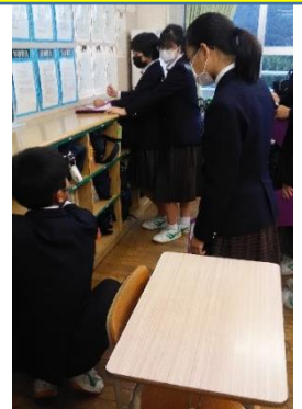
事前の取組をするときの班の目標