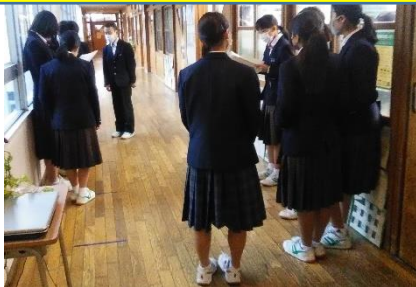
健康系の昼休み・掃除後の手指消毒の様子