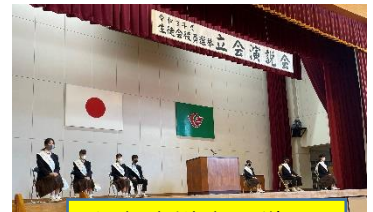
立会演説会の様子