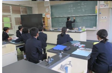
修学旅行実行委員会の様子 みんな真剣に話し合っています。