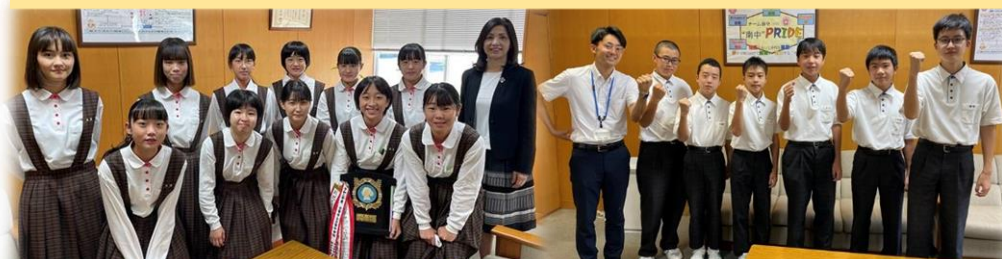
女子バスケットボール部・男子卓球部は、糟屋区新人大会後の校長室表敬訪問で決意を表明し練習に励んできました。

筑前地区大会健闘しました。経験を力に次の目標に向かって頑張ります。応援ありがとうございました。