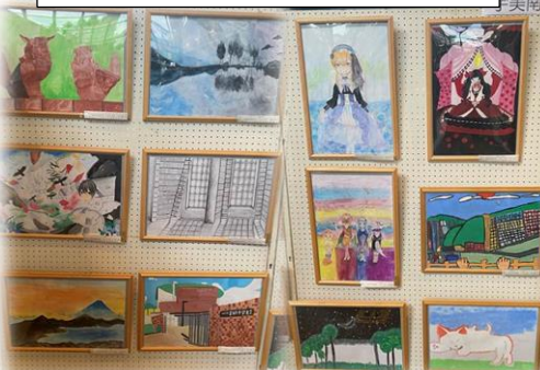
美術部作品展示発表

11月21日(日)にクリエイイト篠栗にて、糟屋区中学校文化連盟総合発表会が開催されました。本校からは、美術部作品・キャリア教育3学年福祉講座の展示発表に出展しました。また、ステージ発表では、吹奏楽部が出場し全員が2グループに分かれてアンサンブル演奏を披露しました。さらに、国語科弁論大会、英語スピーチコンテスト、理科科学研究の各発表においては、代表者が出場及び出品し、自分の考えや学びを発表する貴重な機会に挑戦する素晴らしい南中生の頑張りを発揮してくれました。