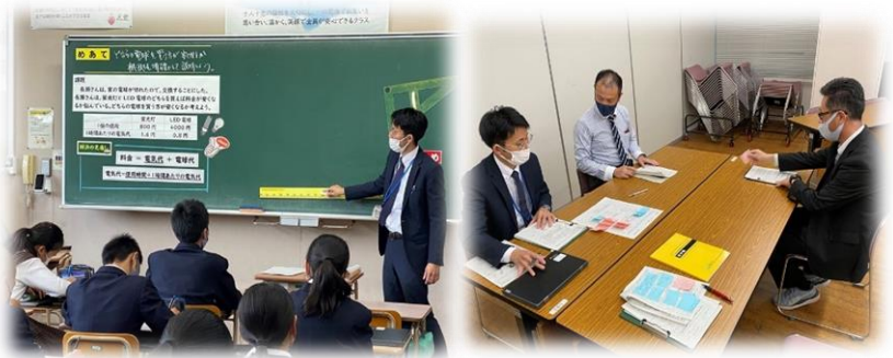
一人1回公開授業研修会と協議会を100%実践しています。

本校では、福岡県の学力と比較・分析できる学力分析テストを年間4回実施しています。実施後は、点数のみの比較ではなく、問題分析や回答内容の分析を行い、その改善策を教科の授業や学年の取組で実践しています。11月のテスト結果ではその成果を見ることができました。何をどのように勉強するか、学びのインプットをアウトプットする家庭学習と連動する確認テストの取組と個別支援を徹底した成果です。コツコツと地道な取組の継続こそが成果を生みます。家庭学習への励ましと見守りをお願いします。