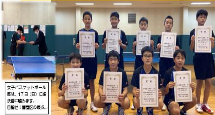
女子バスケットボール部は、17日(日)に準決勝に臨みます。目指せ！糟屋区の頂点。

糟屋区中学校新人男子卓球大会 第三位 筑前地区大会出場決定！おめでとうございます。