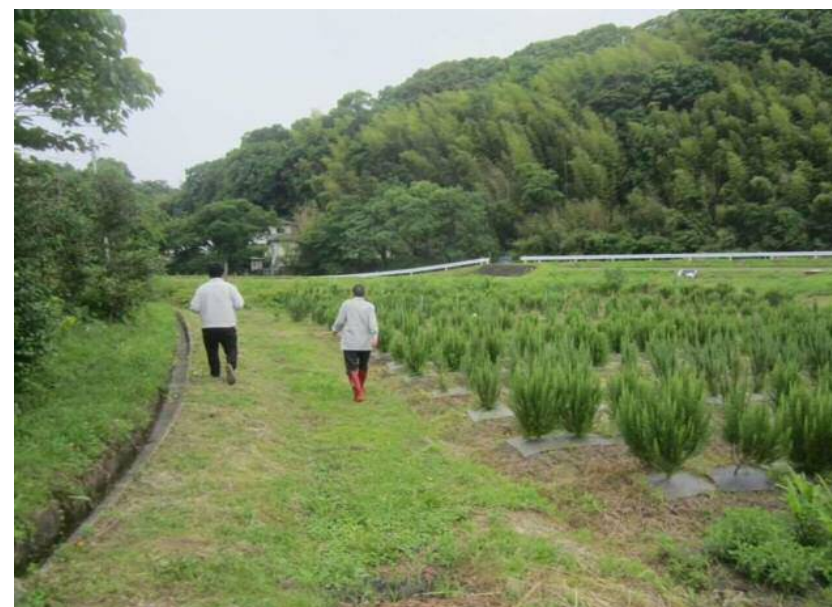
認証機関による実地調査②