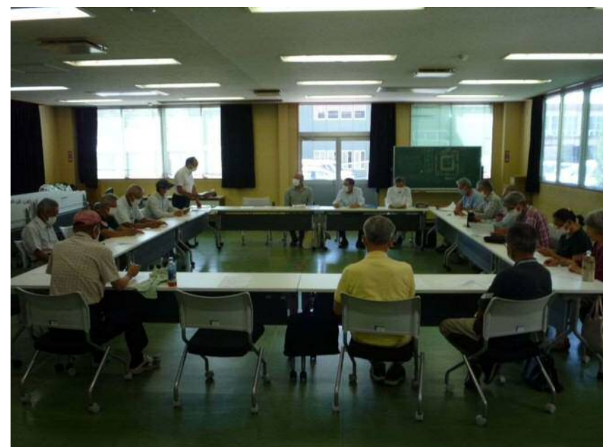
令和3年度 宇美町薬用作物生産部会総会