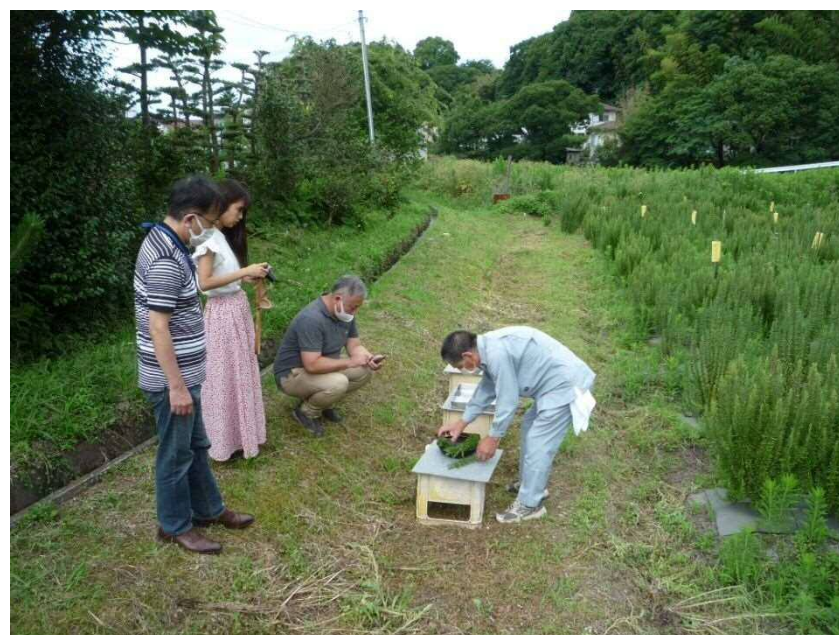
海外展開に伴うPR取材②