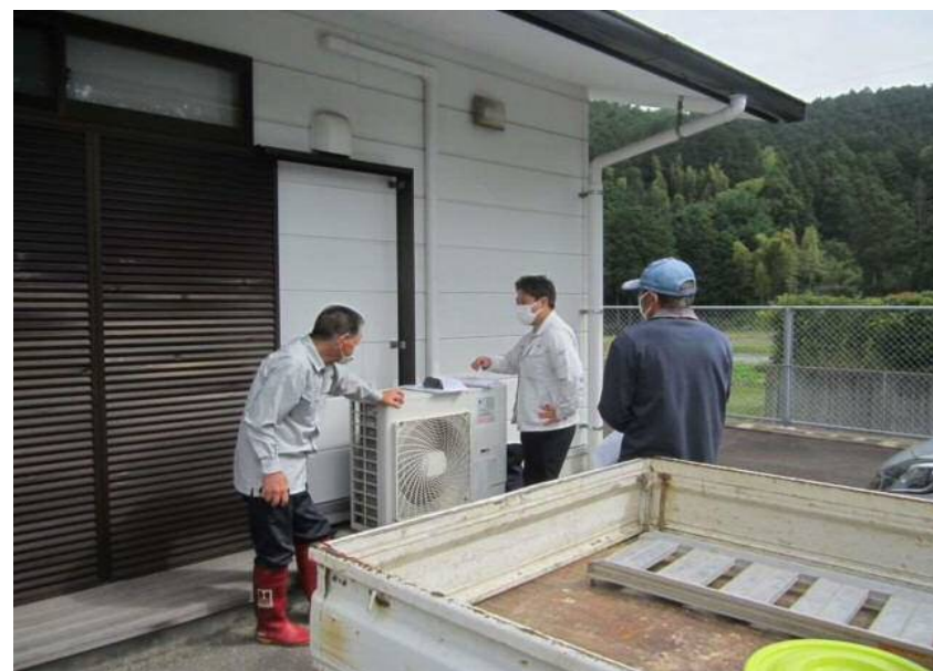
認証機関による実地調査①