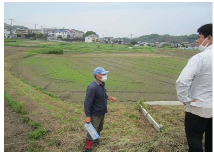
認証機関による実地調査③