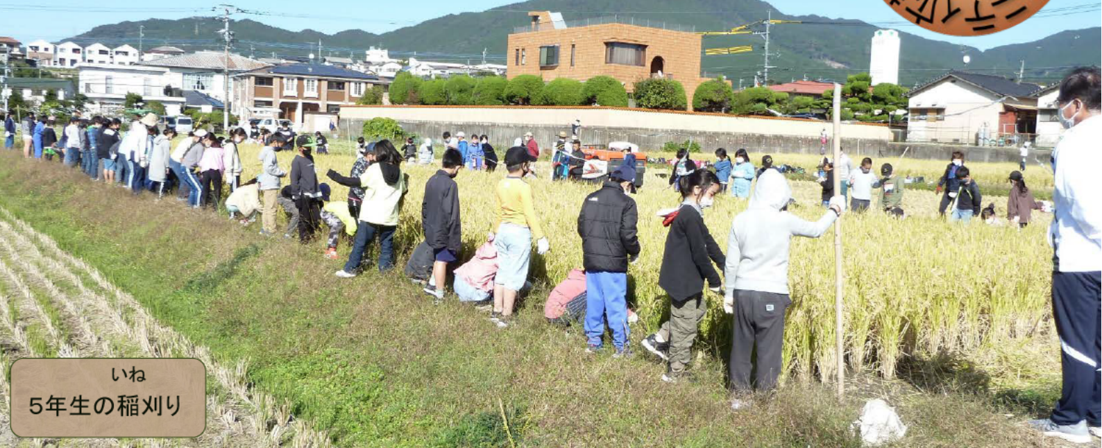
いね 5年生の稲刈り