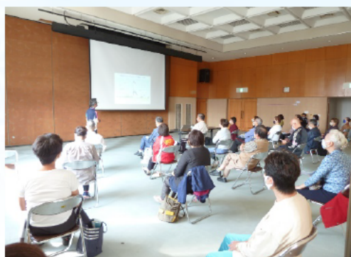
しーず・うみでの受講風景

ウォーキングは楽ですが有酸素運動としての効果が弱く、ジョギングはきつく体にとって危険な場合もあります。そこで、 ややきついと感じる程度 (運動中に軽く息が弾み、会話が楽しめたり鼻歌が歌える程度)で、 初心者では1分走って、30秒歩く (運動、休憩、運動と短時間に繰り返す)、 歩幅は、10cm～20cm程度 (普通に歩く人から追い抜かれます)が スロージョギング です。しかし 運動量は、2倍 と大きいのです。少しの時間の運動の積み重ねで、全身持久力を高める効果が期待できます。