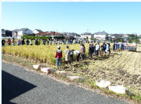
2班に分かれて稲刈りの開始

環境部の方や先生の説明をしっかりと聞いて作業したので、けがをした人は1人もいません。今年は、悪天候やジャンボタニシの影響、さらには稲刈り直前にすずめに食べられるなどで収穫減でした。