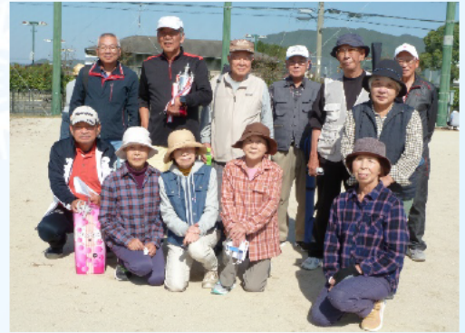
(今回の優勝) 桜原自治会チームの皆さん