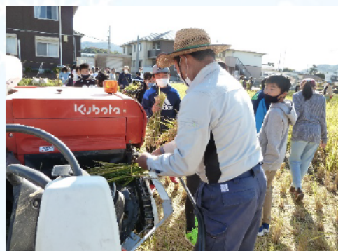
稲穂はコンバインで脱穀します