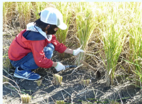
稲束を左手に鎌を右手で刈る