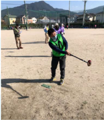
振り子打法が理想的