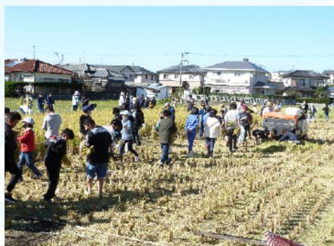
刈った稲穂をコンバインへ運ぶ