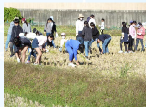
落穂拾いをしているところです