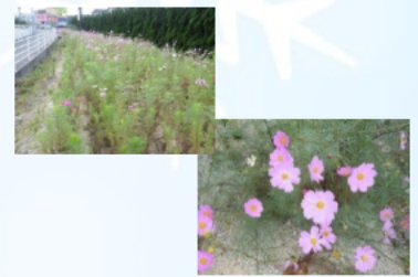
県道35号 筑紫野古賀線 沿いにあるコスモス畑

桜原小学校区コミュニティ運営協議会は、校区という新たな枠組 による取り組みで地域活動を応援し、活性化につなげていきたいと 考えています。