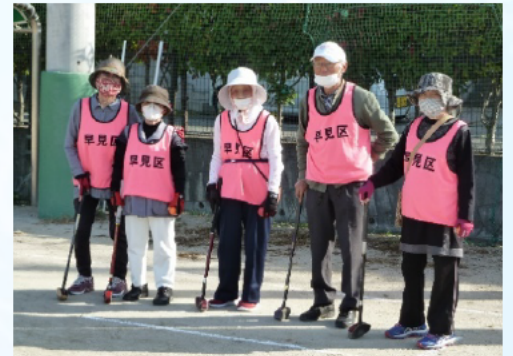
試合開始直前の緊張感