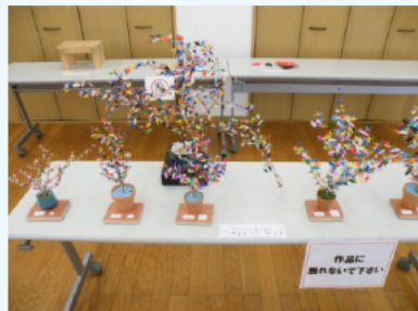
1円玉大またはそれ以下の折り紙を使った作品。レベルが高い!!