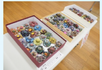
新聞紙で作ったブローチ