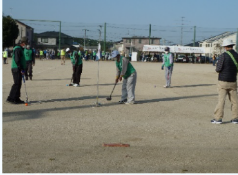
見事にゴールインしました