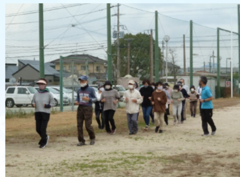
林崎多目的グラウンド場での風景