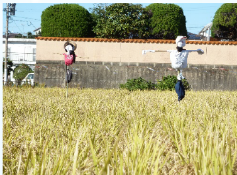
見張り番の案山子も貢献