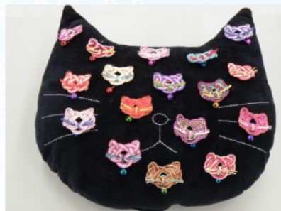
水引を上手に張り付けた猫のクッション