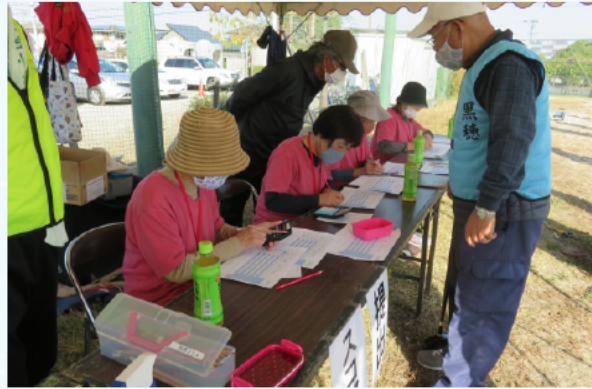
得点の集計も真剣そのもの