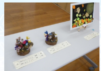
どんぐりなど自然の素材を使った作品