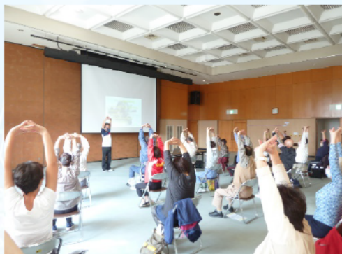
ストレッチの効果や注意点