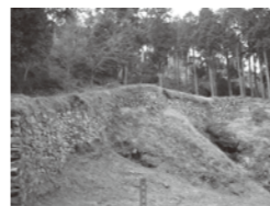
大野城跡の百間石垣

平成27年に大野城跡は築造から1350年目を迎えます。これを記念し、宇美町では10月24日(土)に「大野城跡ウォーキング」を開催します。募集案内はホームページ等で確認下さい。