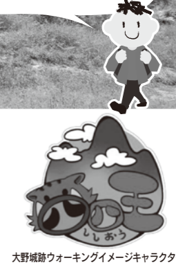
大野城跡ウォーキングイメージキャラクター

四季折々の自然と景観が楽しめる四王寺山。秋を感じつつ、日本最古の古代山城「大野城跡」を学芸員の解説付きで、散策しませんか。