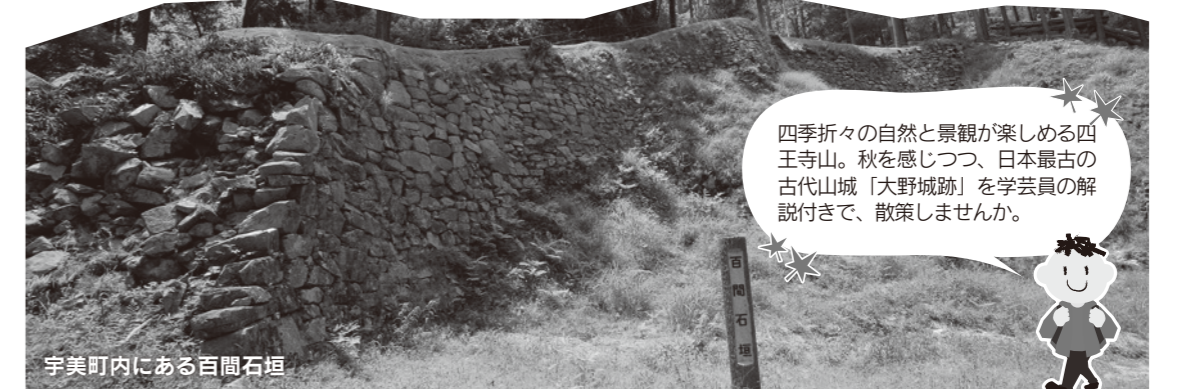
宇美町内にある百間石垣

四季折々の自然と景観が楽しめる四王寺山。秋を感じつつ、日本最古の古代山城「大野城跡」を学芸員の解説付きで、散策しませんか。