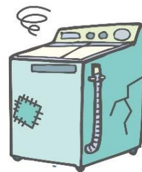
・洗濯機 ・衣類乾燥機