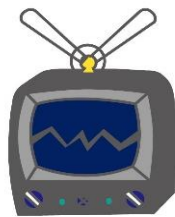
・テレビ (ブラウン管・液晶・プラズマ)