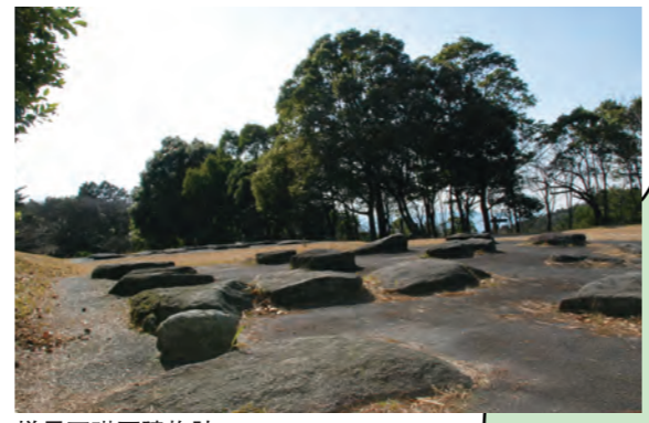
増長天礎石建物跡