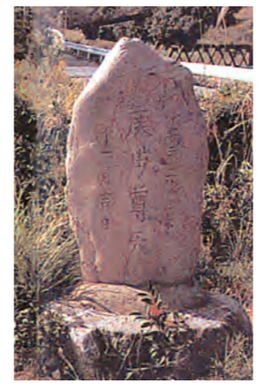
庚申塔 猿田彦 宝満山