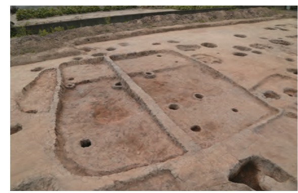
川原田・供田遺跡の住居跡