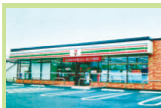
コンビニエンスストア 食料品中心の小型セルフサービス店。弁当や惣菜などの持ち帰り商品を扱う、便利なお店