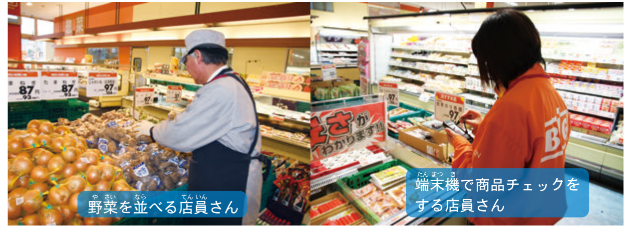
野菜を並べる店員さん

また、買う人は、「品物を探しやすいようにしてほしい。」「品切れがないようにしてほしい。」などの願いをもちます。このような願いにこたえるために、店ではさまざまな工夫や努力をしています。