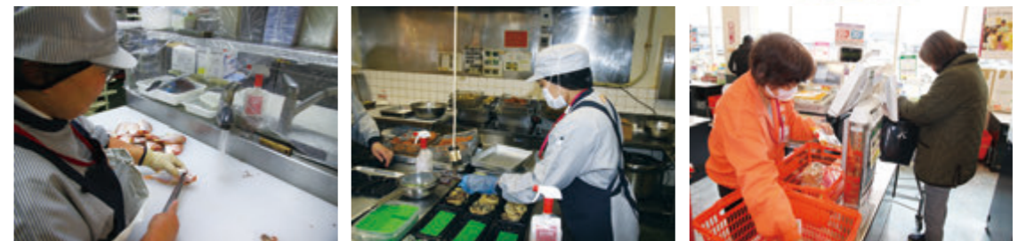
お魚を切る店員さん