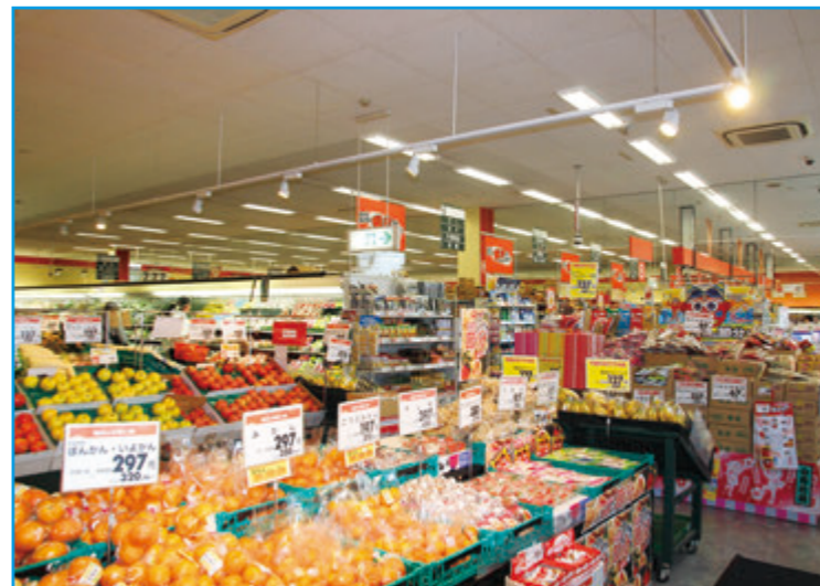
スーパーマーケットの店内