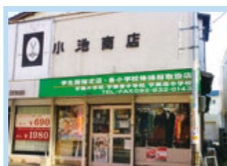
小売店 物品を卸売から買入れて、消費者に分けたりして売るお店