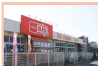
スーパーマーケット 買い手が売り場から直接商品をかごに入れ、レジスターで代金を支払うセルフサービス方式のお店