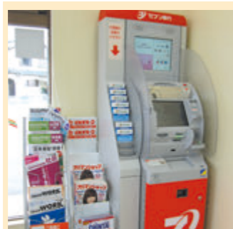
コンビニエンスストアにある銀行のATM