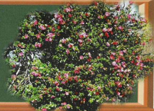
四王寺坂グラウンドのサザンカ