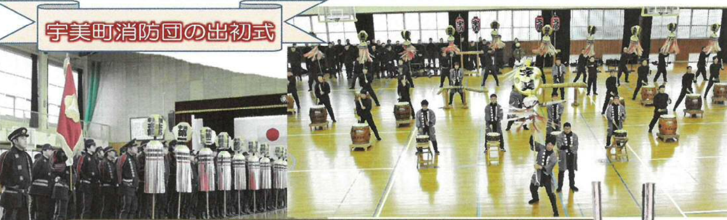
宇美町消防団の出初式

1月12日(日)宇美中学校体育館に於いて、今冬一番とも言われる厳寒の中、令和初、並びに町制100年を迎える意義ある年の出初式が、挙行されました。式典には、全消防分団員はもとより、町長はじめご来賓の方々臨席され、併せてご家族の皆様が見守られる中、午前9時からの安全祈願祭(神事)に引き続き粛々と進められ、終盤では、全団員がワンチームとなり、「伝統技術」が次々と披露され、臨席者に感動と大きな力を与えていただきました。小中高生の皆さん、来年は、正月の「伝統技術」を見学において下さい、学校では学べない何かを得るものもあるかと思ます。 島田