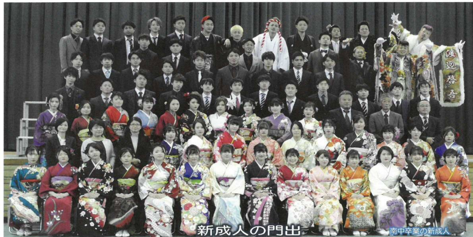
新成人の門出 南中卒業の新成人

1月12日(日)中央公民館に於いて、令和初、オリンピック開催、町制100年、これからも永く記憶に残る意義ある年に、宇美町を担う新成人が集い挙行されました。当日は、雨が上がったものの厳寒の中、新成人が詰めかけ旧交を温めたり、再会を喜んだり、写真を撮ったり、ワイワイ・ガヤガヤと和やかな雰囲気漂っていました。午後一時半からの式典は、宇美太鼓の威勢の良い演奏で幕が開き、町長はじめ多くのご来賓臨席の中、厳粛且つ盛大に挙行されました。なお、今年の新成人は、町内人口の約1.1%の407名(昨年は368名)で、内南中卒業者は80名(昨年は107名)でした。 島田