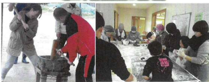
原田下自治会餅つき大会

12月22日(日) 午前9時から、原田下自治会の餅つき大会が多くの親子が参加してとり行なわれました。みんなで協力して、たくさんの餅とあん餅が出来上がりました。 弓削