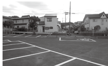
▲駐車場の区画線が分かりやすくなりました。