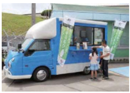
町内のイベントでも大人気