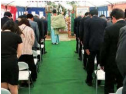
更新住宅2棟建設工事 安全祈願祭の写真