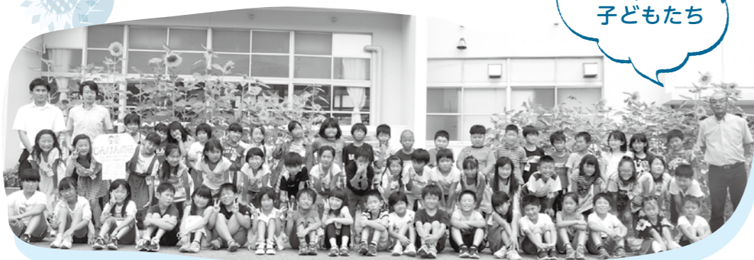
宇美東小学校 3年生の 子どもたち