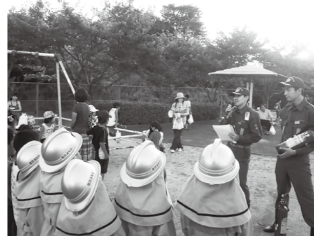
▲防火服に身をつつみ消防団員の話をお聴く子どもたち

住宅火災などの消火活動、火災に備えた消火訓練や水利点検、出水期の水害対応など、宇美町消防団は町民の皆さんの生命と財産を守り安全安心をお届けできるよう日々活動しています。 消防団の活動は火災や水害への対応だけを行っていると思われがちですが、実は季節ごとにさまざまな活動を行っています。地域の夏祭りでは、子どもたちへの啓発活動、会場および駐車場の警備、会場周辺の巡回による安全確認などを行っています。