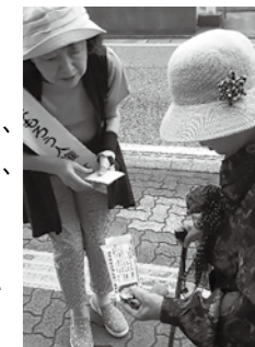
▲たくさんの方に声をかけ街頭啓発を行いました

町では、7月の「同和問題啓発強調月間」、「社会を明るくする運動強調月間」、「青少年の非行・被害防止全国強調月間」の3つの強調月間を「宇美町人権問題啓発強調月間」と定めています。7月1日(月)に、JR宇美駅周辺、町内スーパー2か所で、街頭啓発を行い、人権を尊重する地域社会づくりについて呼びかけました。