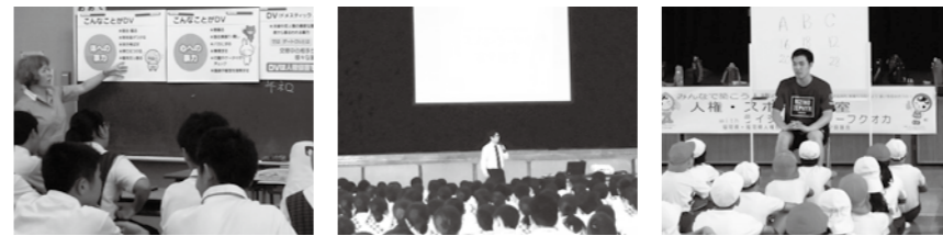
▲人権教室の様子(左:宇美南中 中:宇美中 右:宇美東小)

7月11日(木)宇美南中学校で「デートDV防止プログラム」、12日(金)宇美中学校で「スマホ・ケータイ人権教室」、18日(木)宇美東小学校で「ライジングゼファー福岡による人権・スポーツ教室」が行われました。「デートDV防止プログラム」は、DVDを鑑賞後グループワークを行い、意見を交換し、「自分を大切にすることや、対等で平等な関係を築くために、暴力に正当化はありえない。」ことを学びました。「スマホ・ケータイ人権教室」では、思いやりのある使い方やネットいじめの防止に繋げていくこと、「人権・スポーツ教室」では、バスケットボール体験を通じてコミュニケーションを図り、相手を思いやる気持ちを持つことなど、人権について学びました。