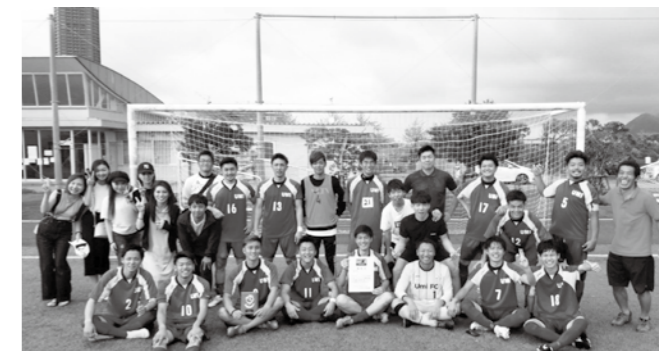
▲優勝して九州大会への切符を勝ち取った選手たち

6月30日(日)、7月7日(日)、14日(日)に福岡フットボールセンターで開催された「第26回全国クラブチームサッカー選手権福岡県大会」で、宇美フットボールクラブが優勝しました。(公財)日本サッカー協会、(一財)全国社会人サッカー連盟が主催する社会人サッカーチームの大会で優勝した宇美町フットボールクラブは、9月7日(土)と8日(日)に大分県で開催される九州大会に福岡県代表として出場します。