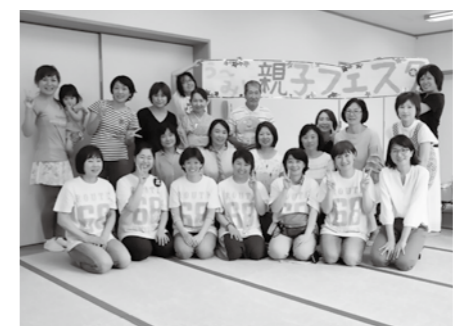
※見学したい人はご連絡ください。詳細はふみらぼまで。

マミたちのマルシェ 日時 10月20日(日) 10時~15時 場所 宇美南町民センター 定例会 毎月第3金曜日の10時から12時に、ふみらぼで楽しく定例会を開催していますので、ぜひ見学に来てください。