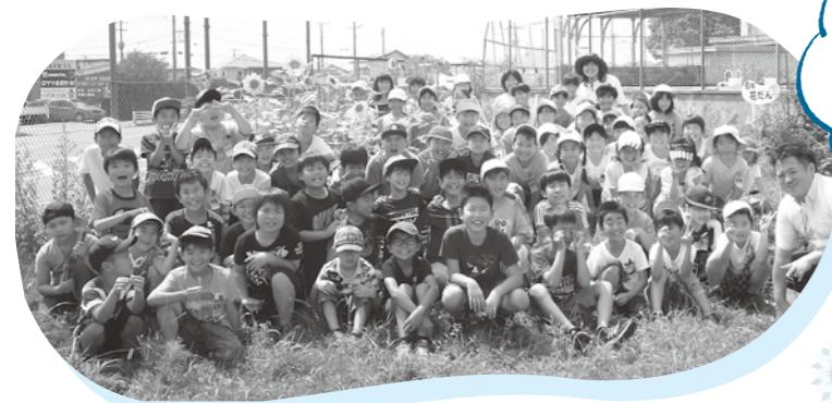
桜原小学校 3年生の 子どもたち