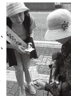
▲たくさんの方に声をかけ街頭啓発を行いました

町では、7月の「同和問題啓発強調月間」、「社会を明るくする運動強調月間」、「青少年の非行・被害防止全国強調月間」の3つの強調月間を「宇美町人権問題啓発強調月間」と定めています。7月1日(月)に、JR宇美駅周辺、町内スーパー2か所で、街頭啓発を行い、人権を尊重する地域社会づくりについて呼びかけました。