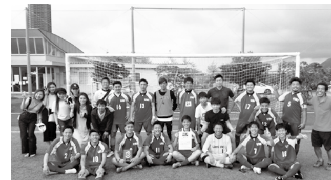
▲優勝して九州大会への切符を勝ち取った選手たち

(公財)日本サッカー協会、(一財)全国社会人サッカー連盟が主催する社会人サッカーチームの大会で優勝した宇美町フットボールクラブは、9月7日(土)と8日(日)に大分県で開催される九州大会に福岡県代表として出場します。