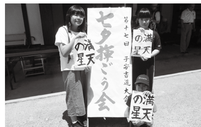
▲上手に書けました!!

町内から113人の小学生が参加し、どの子どもたちも真剣な表情で筆を走らせていました。