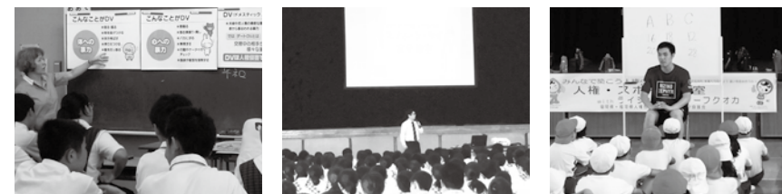
▲人権教室の様子(左:宇美南中 中:宇美中 右:宇美東小)

「デートDV防止プログラム」は、DVDを鑑賞後グループワークを行い、意見を交換し、「自分を大切にすることや、対等で平等な関係を築くために、暴力に正当化はありえない。」ことを学びました。「スマホ・ケータイ人権教室」では、思いやりのある使い方やネットいじめの防止に繋げていくこと、「人権・スポーツ教室」では、バスケットボール体験を通じてコミュニケーションを図り、相手を思いやる気持ちを持つことなど、人権について学びました。