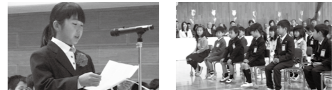
▲決意を述べる中学生(宇美南中) ▲先生の話を集中する新1年生(井野小)

4月10日(水)に町立中学校で、4月11日(木)には町立小学校で入学式が行われました。今年度は、町内の小学校に384人、中学校に377人の新入生が入学しました。井野小学校では、担任の先生からの呼名に「はい」と元気に返事をして立ち上がるかわいらしい1年生の姿に、会場が笑顔に包まれました。式に参加した6年生は、最上級生らしい優しさ溢れるあいさつで1年生の入学を歓迎しました。また、宇美南中学校では、まだ少し大きい制服に身を包み、期待と緊張が入り混じった表情で入場する1年生の姿が印象的でした。