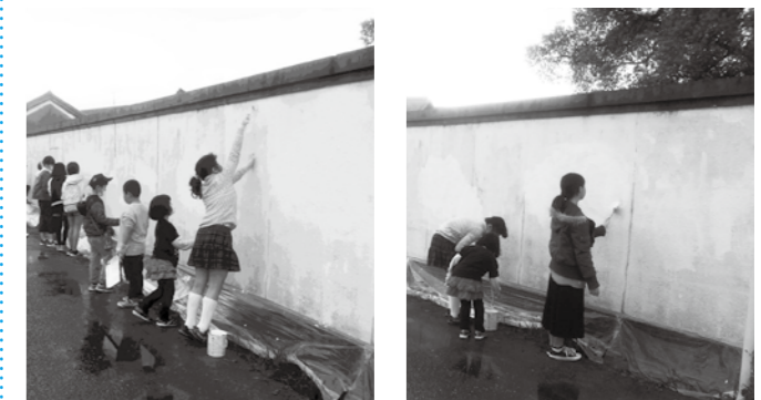
▲みんなで協力して作業しました ▲きれいに落書きを消していきます

3月23日(土)、馬場自治会育成会の小学1～6年生の12人が、壁の「落書き消し」を行いました。10か所ほどの壁の落書きを、みんなで手分けして手際よく消していきました。落書き消しの活動後、みんなさわやかな気持ちで、その道を通ることができるようになりました。