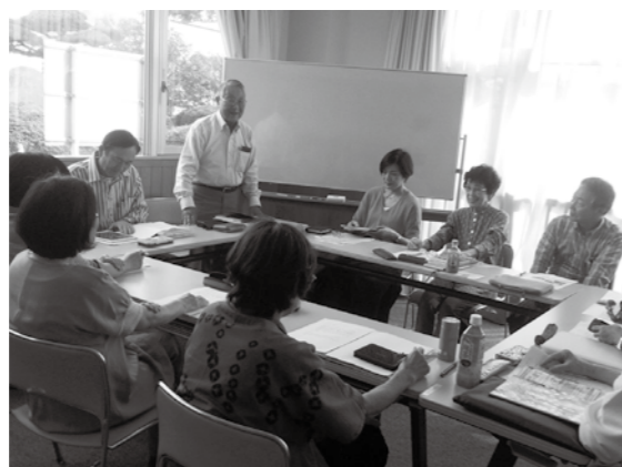
▲昨年度の秋のボランティア体験月間の様子

問 ボランティア・町民活動支援センター ふみらぼ(し〜ず・うみ内) ☎&FAX933-1110