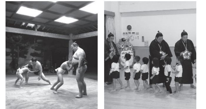
▲尾上部屋の力士から稽古をつけてもらう子どもたち

また、町内の保育園を訪問した力士たちは、初めて本物の力士を見て喜ぶ子どもたちと相撲を取ったり給食を食べたりして過ごしました。最後には子どもたちから『頑張ってください』とエールを送られました。