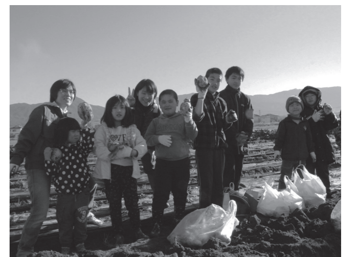
▲顔の大きさと同じくらいのじゃがいもがたくさん!

参加者の皆さんは、スコップなどで土の中に埋まっているじゃがいもを掘りおこし、袋いっぱいになるまで思い思いに収穫を楽しんでいました。