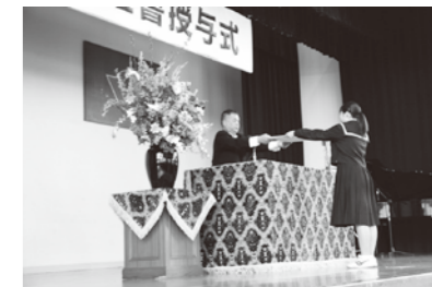
クラスを代表し卒業証書を受け取りました(宇美中学校)