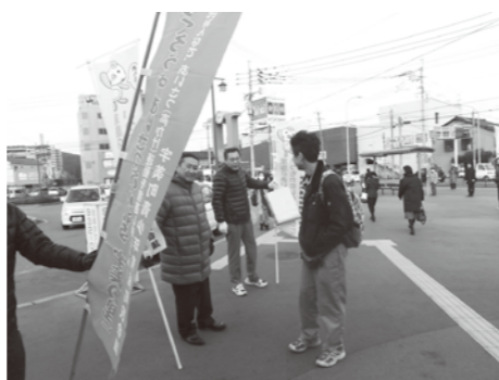
おはようと声をかけました

※宇美町青少年育成町民会議とは青少年問題のもつ重要性を考え、広く町民の総意を集め、国、県および町の施策を生かして、青少年の健全な育成および非行防止を図ることを目的とし、宇美町の青少年育成に関係のある機関、団体をもって組織されています。