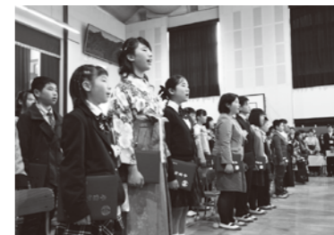
別れの言葉では小学校6年間の思い出と感謝の言葉を伝えました(宇美小学校)

宇美中学校の卒業式では、卒業生や在校生だけでなく、来賓の方も含め、会場全体で卒業生にとって最後となる校歌を歌いあげ、今年創立70周年を迎える宇美中学校の伝統を感じる卒業式となりました。