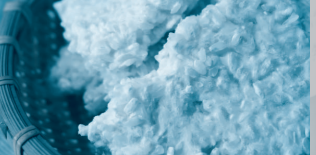
▲原料の米麴にもこだわっています オレ!アマ：500ml 500円 ※数量限定 450本