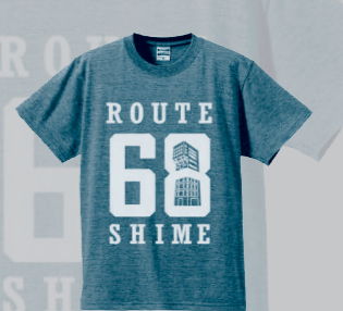
▲色もサイズもたくさんあります