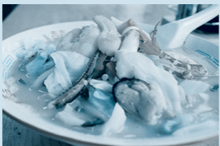
▲冬季～初夏限定のアコヤ貝柱入り海鮮ちゃんぽん