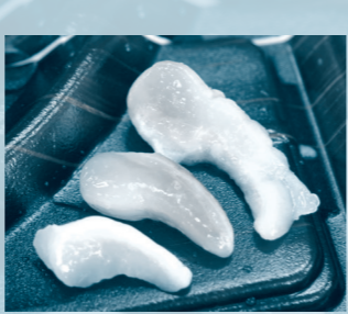
▲まが玉のような形