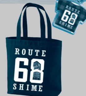
▲お好みのグッズを見つけてください