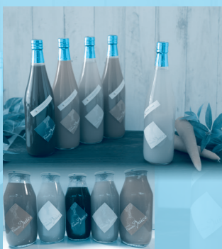
▲ニンジンジュース大・小