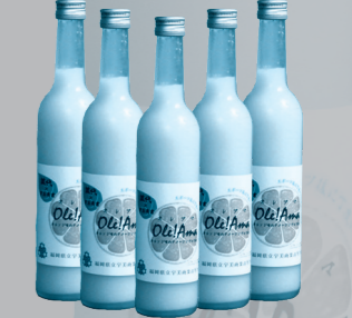
▲さわやかな味わいです