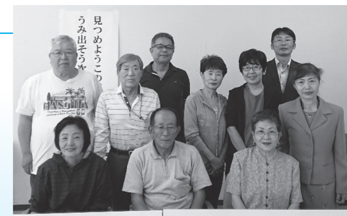
▲健康・福祉のアドバイザー!いつも身近に民生委員