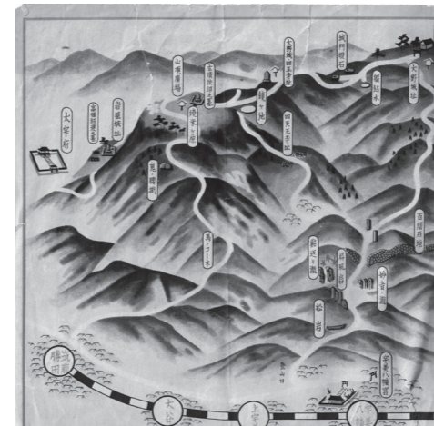
▲四王寺山の観光案内図(昭和5年)