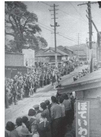
▲宇美八幡宮放生会での流錦馬の様子 (昭和30年頃)