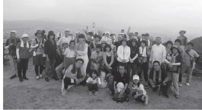
▲井野山山頂からの絶景を前に 参加者皆さん ハイチーズ!

山頂に到着して間もなく、刻々と移ろう色彩豊かな夕焼けの景色に、参加者から歓声があがりました。また、全方位360°の眼下に広がる美しい夜景に、皆さんの目は奪われていました。