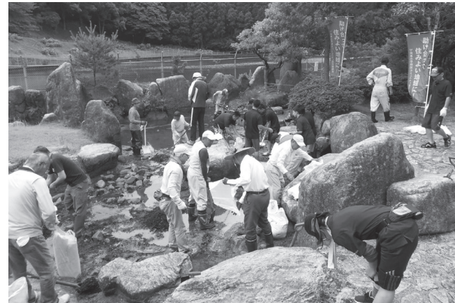
▲清掃作業に参加していただいた皆さん、ありがとうございました