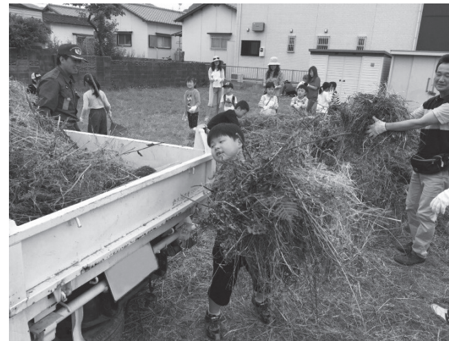
▲たくさんの刈った草をがんばって軽トラックに積み込みました!

また、小中学生など多くの子どもたちも積極的に参加し、地域の方々と共に空き缶やペットボトルなどのごみを拾い、町をきれいにしていました。