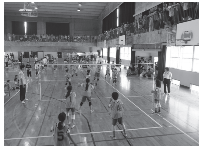
▲練習した成果を発揮し、熱戦が繰り上げられました