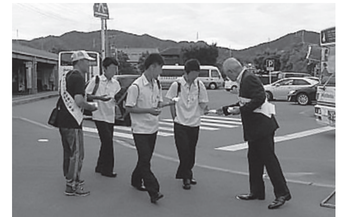
▲推進委員の皆さんがJR宇美駅前で啓発活動を行いました

「社会を明るくする運動」は、罪を犯した人の更生について理解を深め、地域の人々が力を合わせて犯罪や非行の無い明るい社会を築こうとする、全国的な運動です。当町でも、「第68回社会を明るくする運動宇美町推進委員会」が中心となり、7月2日(月)早朝より、JR宇美駅、町内各中学校の校門前で、声掛け運動やポケットティッシュやチラシといった啓発物を配布する啓発活動が行われました。