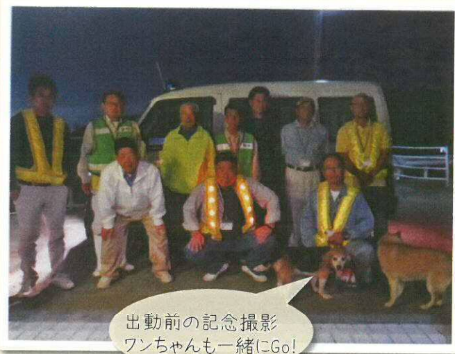
出動前の記念撮影 ワンちゃんも一緒にGo!

三原自治会パトロールクラブが、粕屋地区(1市7町)安全安心大会において、 防犯功労団体賞 を受賞しました。10月19日(木)志免町シーメイトで行われた粕屋地区安全大会において、これまでの功績を評価され宇美町では2番目の表彰となります。三原パトロールクラブは平成22年に創立、現在会員は18名。30代～70代と幅広い構成となっています。三原自治会は東西に長く、また高低の起伏も激しく、徒歩での巡回は困難なため週に1回青バトにてパトロールし、定期的に徒歩にて細かな監視を行っています。会員さんは仕事や家庭でお忙しい中、皆で楽しく今日も町の安全と安心のために頑張ってください! パトロール中の皆さんに出会いましたら、お声をかけをよろしくお願いいたします!