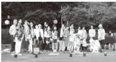
昨年のホテル観覧会