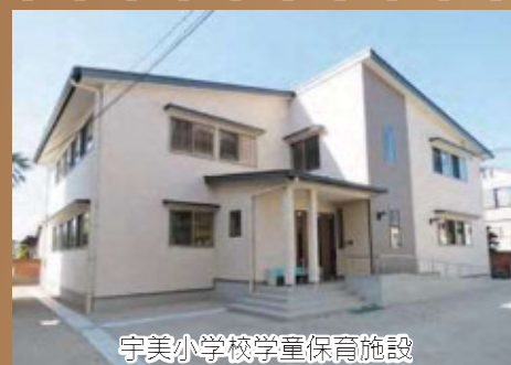
宇美小学校児童保育施設