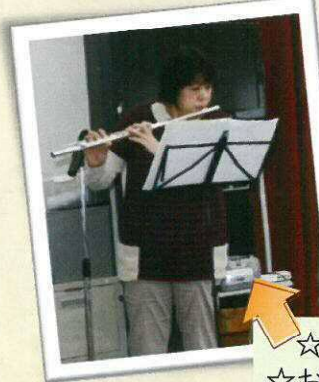
☆フルーツ生演奏 ☆おしながき ☆豪華な料理

12時、かっぽう着に身を包んだ男衆の活気のある挨拶から始まりです。旬の食材を生かした鍋、活きた魚をさばいた刺身などなど、豪華な料理に加えフルーツの生演奏やオペラの披露などもあり、和気あいあいと弾む会話にお客様の笑顔は笑顔でいっぱい、お腹は満腹、スタッフ一同「来年やりた〜い!」とみんなが元気なる昼食会でした。