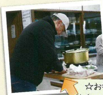
☆おもてなし男衆 ☆魚のさばきはプロ級