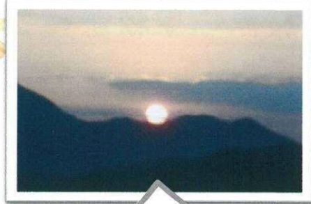
井野山からのぞむ初日の出 (桜原区恒例元旦登山)

今まで準備を進めてきました地域コミュニティが本格始動致します。多くの皆様のご意見とご提案で、より楽しい地域作りが出来ますので、どうぞ足をお運びください!