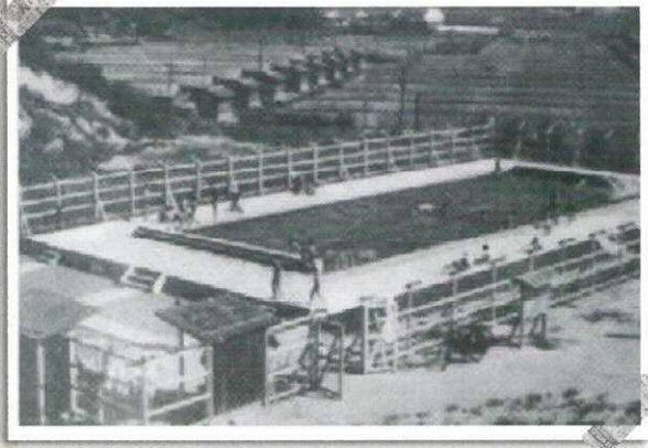
三菱勝田炭鉱子供プール (昭和33年ごろ) ★古い校区内のお写真をお持ちの方はご連絡ください(*^*)

今号ではどんど焼きの話題をお伝えしましたが、神武病院の上には広い敷地が広がります。草が生い茂っていますが、実はここに「勝田こどもプール」があったことをご存知でしょうか? 昭和20～30年代は、三菱勝田炭鉱として、桜原校区は大変賑わいました。その賑わいを現す一つの写真がこれ!よく見ると、プールサイドでくつろぐ人、飛び込み打ちあがる水しぶきなど、賑わいの様子が映し出されます。写真の向こう側は、今の柳原区。ここで炭鉱で働く人たちの元気な声が響いていたんですね。 もっと目を凝らして向こう側を見ましたら、昔あった「神武原小学校」が写っています。大変貴重な1枚ですね。