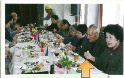
☆美味しい料理に大満足 ☆じゃんけん大会

「男料理」と銘打って、毎年1回一流料理店並みの雰囲気と料理で、人生の先輩方をおもてなしする会です。今年度は27名のお客様を20名のスタッフが迎えいたしました。