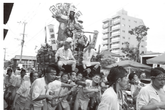
間近で見る山笠は迫力満点