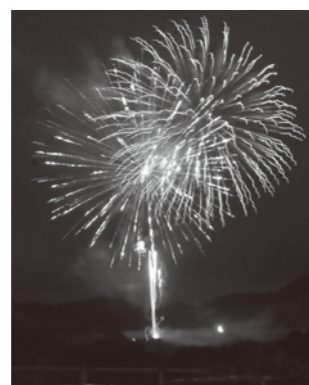
夜は花火にうっとり

時間などは未定ですので、詳細は篠栗町ホームページをご覧ください。お問い合わせください。