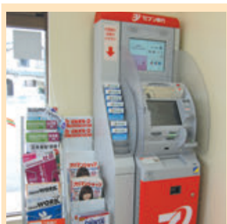
コンビニエンスストアにある 銀行のATM