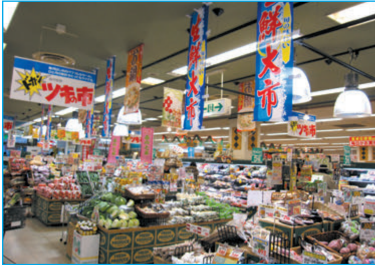
宇美駅前のスーパーマーケット