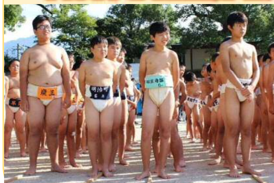
原田の郷・力士の勇姿