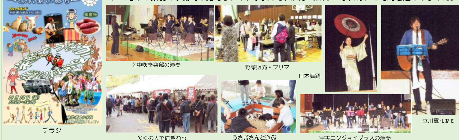
南中吹奏楽部の演奏 野菜販売・フリマ 日本舞踊 ちらし 多くの人でにぎわう うさぎさんと遊ぶ 宇美エンジョイプラスの演奏 川翼・LIVE

11月13日(日)、第1回となる「原田の郷・ふれあい祭り」が盛大に開催されました。当日は21種類もの各種展示・イベントが準備され、約2,500人の参加者でにぎわいました。特に、ふれあい移動動物園はヒツジ、ヤギ、ひよこ、うさぎ、ハリネズミ等90頭羽の小動物が勢ぞろいし、子供から大人まで楽しいふれあいの時間を過ごしました。