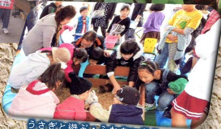
うさぎと遊ぶ・ふれあい祭り