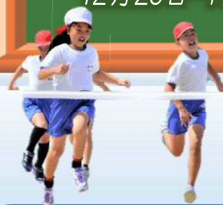
小学校最後の運動会

晴れて絶好の運動会日和となった10月2日(日)第36回原田小学校運動会が開催されました。今年のスローガンは 全力!心を一つに!最後まで!! です。会場は、保護者、地域の皆さんが早朝からつめかけ熱気に包まれていました。競技は5年生の「GO GO JUMP!」を皮切りに熱戦が展開され「元気な原田っ子」の本領が随所に見られました。 松本