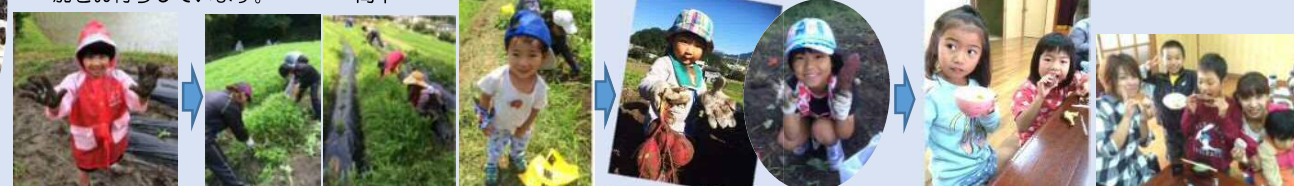
雨の中のうえつけ 4回におよぶ雑草とのたたかい! まちに来た収穫・大きいもがとれました いもパーティーで美味しくいただきました

秋晴れの中、はるだチャレンジスクールでは、サツマイモの収穫体験を行いました。自然体験を通して沢山のことを学びたいと始めた「サツマイモを育てよう」企画です。雑草の成長の速さに驚き、除草作業の日を追加したり、収穫間際になってのイノシシの出没により急遽、収穫日を早めたりと、手探りでやってきた体験でした。収穫当日は、老若男女、100名を超える参加者が集まり、みんな笑顔で沢山のさつまいもを掘って持って帰る事ができました。今年度の体験に参加出来なかったみなさんの、来年度の参加をお待ちしています。 高木