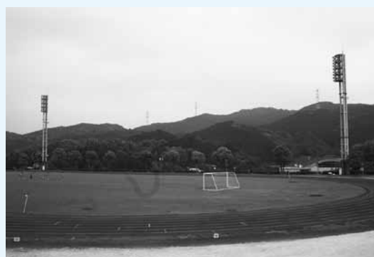
宇美町総合スポーツ公園