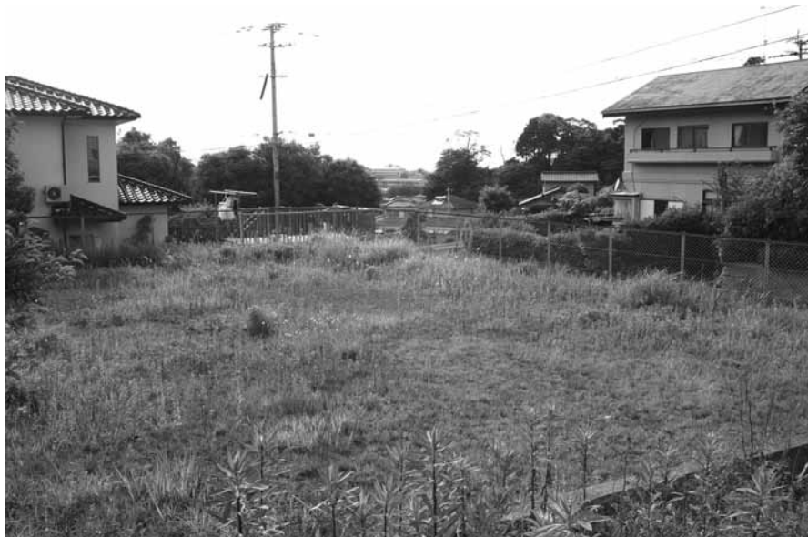
売却の対象となる町有地