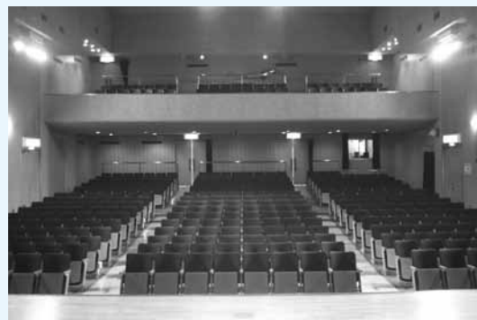
宇美町立中央公民館大ホール