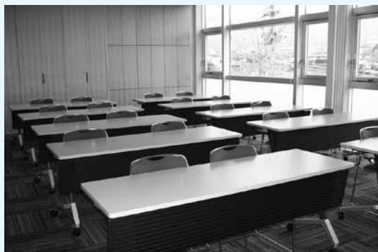
宇美町地域交流センター研修室A

今後、町民が利用する公共施設使用料の設定及び改定にあたっては、原則として3年毎に行います。また、使用料設定の基本方針につきましても、原則として5年毎に見直しを行います。