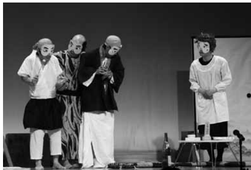
宇美町青年団による博多仁〇加

5月16日(土)、17日(日)に町立中央公民館及び、住民福祉センターにおいて、「第30回町民文化のつどい」が盛大に開催されました。