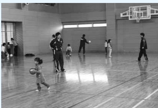
宇美南町民センター体育館

平成21年10月からは、宇美町の公共施設を利用する際には、新料金による使用料が必要になります(体育施設、文化施設及び学校施設は、12月利用分から対象になります。詳細は6～7ページ参照)。また、利用の対象、活動内容等に基づく使用料の減免等については、合わせて見直しが行われていますので、ご参照ください。