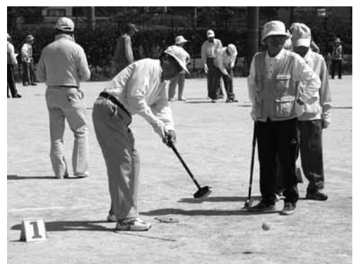
狙いを定めて、ナイスショット！！

大会当日は、とても暑くなりましたが、それぞれが真剣な表情でプレーしていました。また、ホールインワンが飛び出す場面もあり、会場から大きな拍手が巻き起こりました。