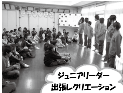
ジュニアリーダー 出張レクリエーション の様子

大人に頼らない子ども会活動を目指し、宇美町に住む中学生を対象に組織されています。現在は、高校生、大学生となったメンバーも含め、若くて意欲のある子どもたちが、子ども会活動の支援だけでなく、子ども会リーダー(6年生)の育成や町の行事のお手伝いなどを行っています。