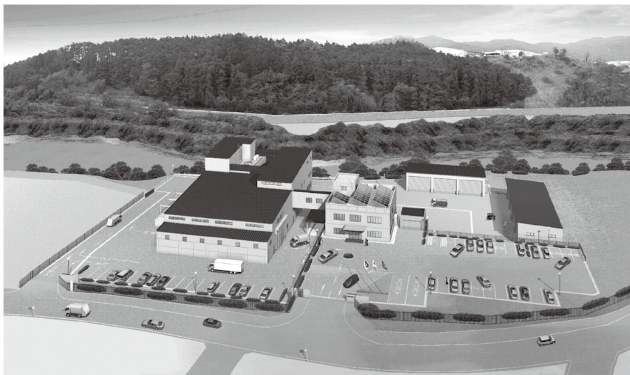
宇美町・志免町衛生施設組合リサイクルセンター完成イメージ図