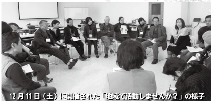
12月11日(土)に開催された「地域で活動しませんか?」の様子