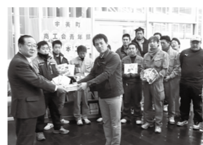
宇美町商工会青年部贈呈式の様子

そこで、図書館児童コーナーの中に「宇美町商工会青年部寄贈本コーナー」を設置しました。どの本も貸出可能です。皆さんぜひ図書館にお越しください。