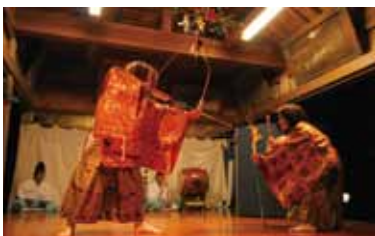
「宇美神楽」 県指定無形文化財の

県指定無形文化財の宇美神楽(うみかぐら)が奉納される場所です。神楽とは神様を祀る舞のことで、宇美神楽は江戸時代に広まった里神楽が源流と言われています。年2回、春の子安祭と秋の放生会の時に奉納されます。