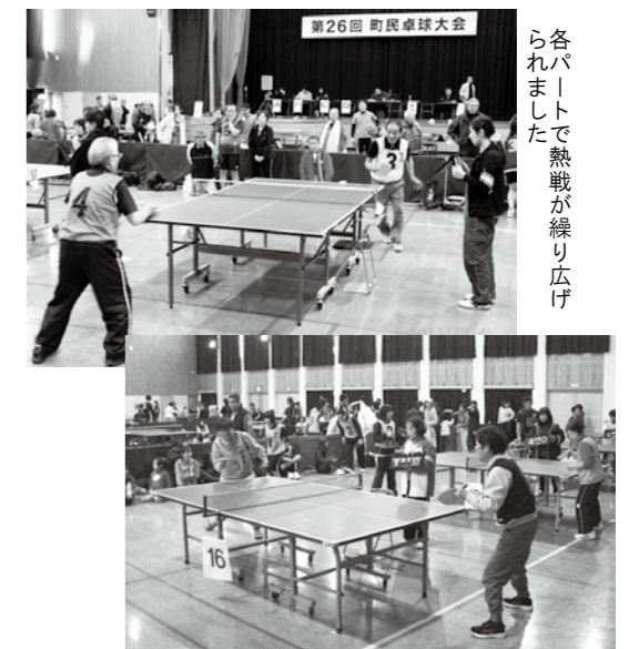
各パートで熱戦が繰り広げられました