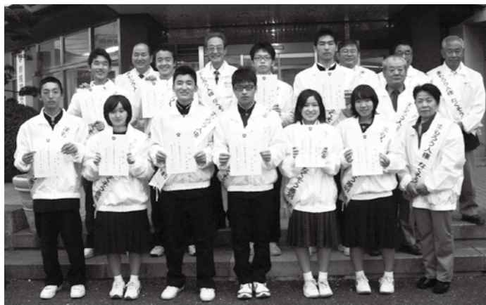
一日人権擁護委員として、人権について考えました

福岡県人権擁護委員連合会及び福岡法務局では、12月4日から12月10日までを「人権週間」と定め、人権意識の普及高揚を図るため様々な啓発行事を行っています。