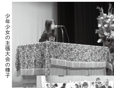
少年少女の主張大会の様子

11月20日（日）に行われた「ふみの里まなびの森フェスタ」の中で、「第13回宇美町少年少女の主張大会」が開催され、町内各小中学校の代表8名の児童生徒が、それぞれの思いを主張しました。