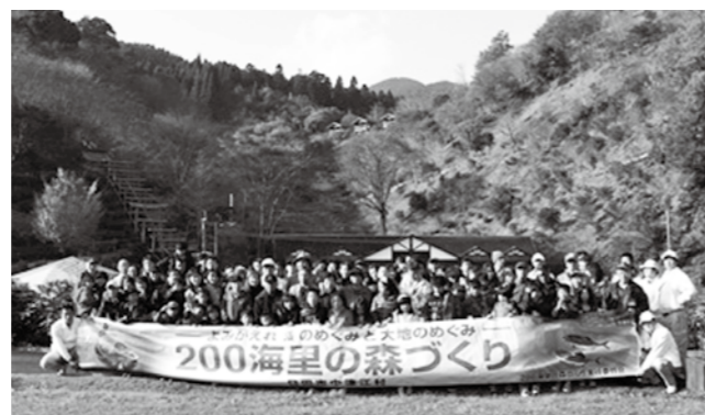
200海里の森づくりに参加した方々

当日は、植栽の手順を教わりながら植樹活動をしたり、那珂川町の方々とパーベキューをして交流をしたりと、参加した方は楽しみながら自然の大切さを学びました。