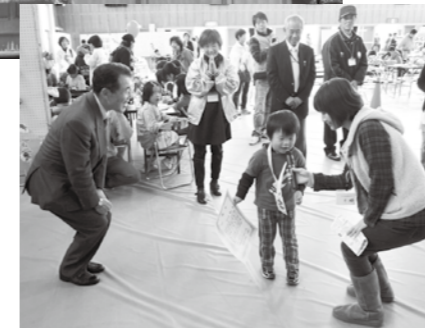
あいさつチャンピオン大会の様子