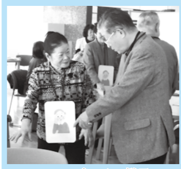
ロールプレイの様子

受講した方には、「認知症の方を支援します」という意思を示す オレンジリング が渡されます。