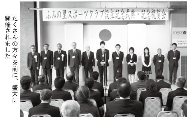
たくさんの方々に開催されました

2月10日(日)に働く婦人の家し〜ず・うみにおいて、総合型地域スポーツクラブ「ふみの里スポーツクラブ」設立記念式典・記念祝賀会が開催され、県・郡のスポーツ関係者をはじめ、多くの来賓が出席し、クラブ